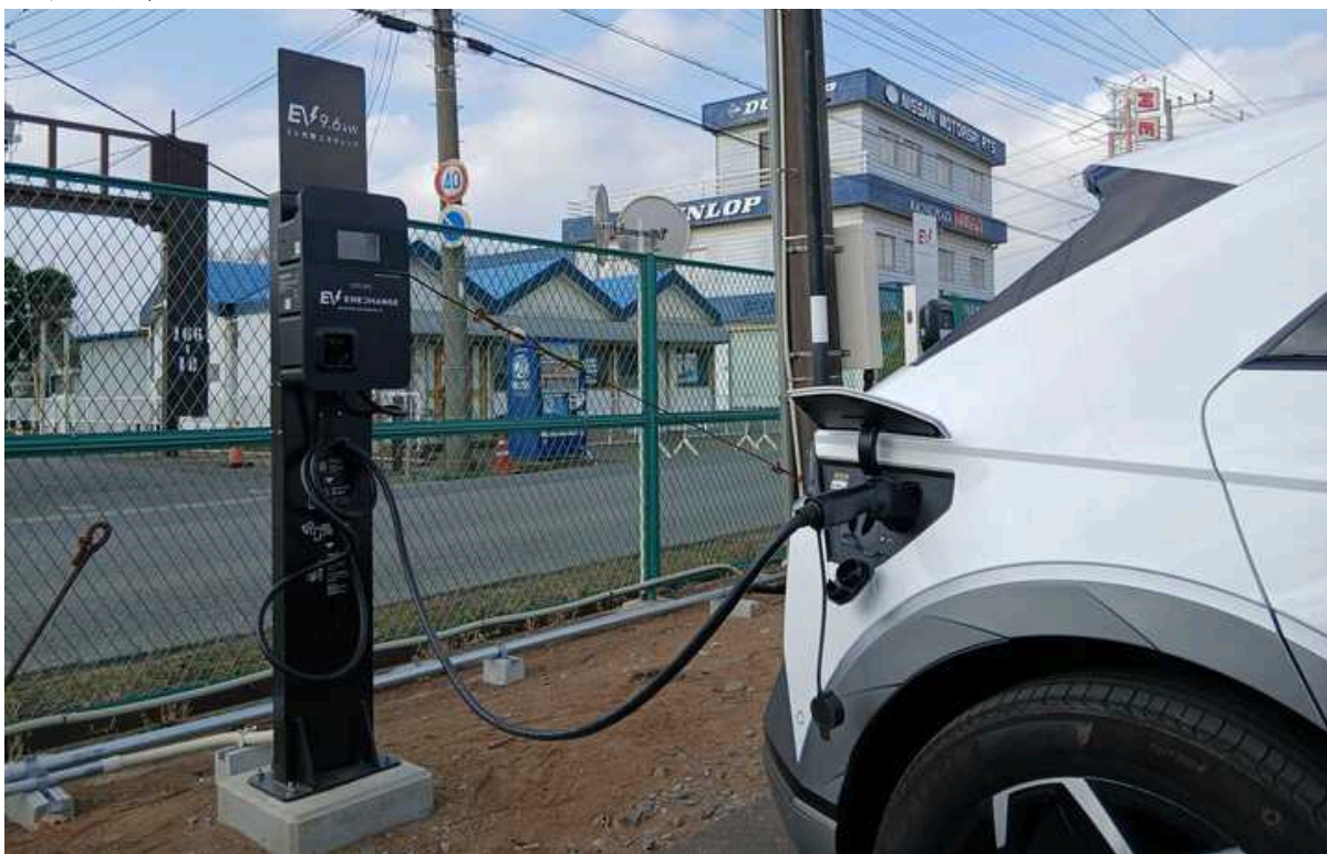
筑波サーキットに設置されている9.6kW出力の充電器